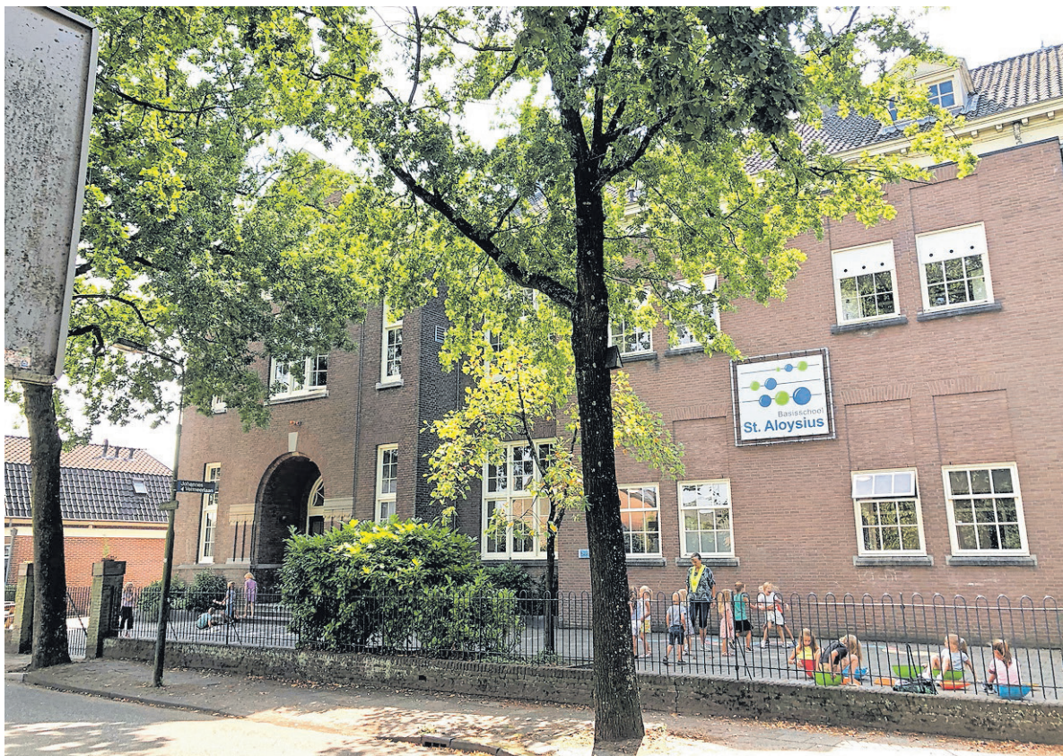
Het schoolgebouw aan de Kerkstraat.