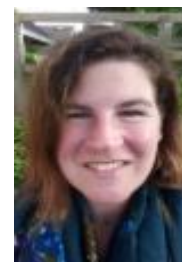
Claire groep ½ Jip&Janneke