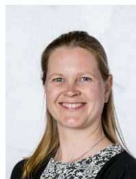
Marijke groep ½ Jip&Janneke