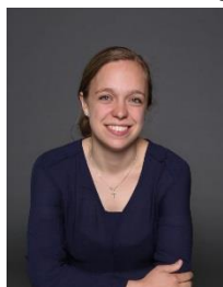
Monique groep ½ Aadje Piraatje